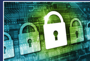
Datenschutz & Sachverständigenwesen